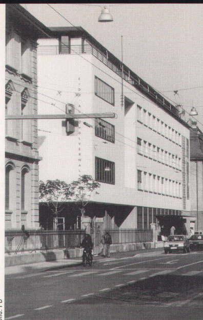
Die Eidgenössische Alkoholverwal- tung: «aus alt mach neu»