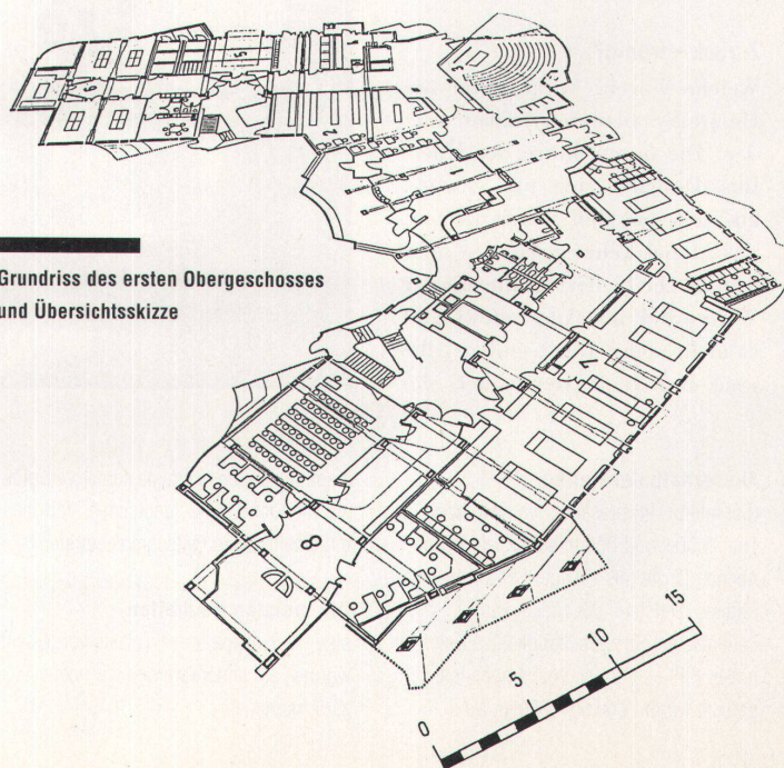
Grundriss des ersten Obergeschosses und Übersichtsskizze