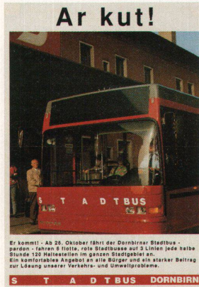
Ar kut! Er kommt - Ab 28. Oktober fährt der Dornbirner Stadtbus - pardon - fahren 8 flotte, rote Stadtbusse auf 3 Linien jede halbe Stunde 120 Haltestellen im ganzen Stadtgebiet an. Ein komfortables Angebot an alle Bürger und ein starker Beitrag zur Lösung unserer Verkehrs- und Umweltprobleme. S T A D T B U S DORNBI RN

Was für eine mittelgrosse Schweizer Stadt wie Schaffhausen oder Chur Alltag ist, ist in Dornbirn, einer Stadt im Vorarlberg, ein Ereignis: Seit ein paar Wochen fahren Busse durch die Stadt. Der Stadtbus ist als Resultat eines Wettbewerbes von der Grafik, über die Fahrzeuge, die Arbeitskleider, das Strassenmobiliar bis zu Route, Fahrplan und Infoplakaten (Bild) konsequent gestaltet worden. Eine Reportage von Köbi Gantenbein.