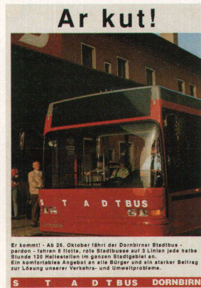
Ar kut! Er kommt - Ab 28. Oktober fährt der Dornbirner Stadtbus - pardon - fahren 8 flotte, rote Stadtbusse auf 3 Linien jede halbe Stunde 120 Haltestellen im ganzen Stadtgebiet an. Ein komfortables Angebot an alle Bürger und ein starker Beitrag zur Lösung unserer Verkehrs- und Umweltprobleme. S T A D T B U S DORNBI RN

Was für eine mittelgrosse Schweizer Stadt wie Schaffhausen oder Chur Alltag ist, ist in Dornbirn, einer Stadt im Vorarlberg, ein Ereignis: Seit ein paar Wochen fahren Busse durch die Stadt. Der Stadtbus ist als Resultat eines Wettbewerbes von der Grafik, über die Fahrzeuge, die Arbeitskleider, das Strassenmobiliar bis zu Route, Fahrplan und Infoplakaten (Bild) konsequent gestaltet worden. Eine Reportage von Köbi Gantenbein.