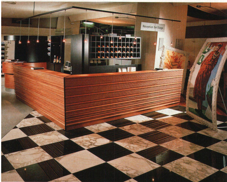
Réception im Hotel Bel Etage – made by Röthlisberger

Angenommen, ein Nachtessen kostet hundert Franken. Da erwartet jeder etwas Rechtes – und wird meist nicht enttäuscht. Schweizer Köche haben schliesslich einen guten Ruf. Angenommen, eine Nacht im Hotel kostet gleichviel. Da ist jeder froh, zumal in einer Stadt, wenn er dafür ein Dach über den Kopf erhält, und er hat es sich abgewöhnt zu fordern, dass für diesen Preis eigentlich wohltuende Atmosphäre drin liegen müsste, dass er als Nichtraucher zum Beispiel keine stinkenden Vorhänge und Teppiche in Kauf nehmen muss. Kurz: Der Stand der Einrichtung entspricht nicht dem Stand der Küche. Das hat damit zu tun, dass in der Hotellerie Küche und Keller Männerdomänen sind, während Saal und Zimmer zum Reich der Hoteliers-Frauen gehören. Und da die Männer die Investitionsströme lenken, wird eher auf der Etage gespart als in der Küche.