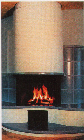
Strahlungswärme dank der Ofen-Cheminée-kombination Scanakam mit Unterabbrand von RMB, bei Intercon, Dietlikon