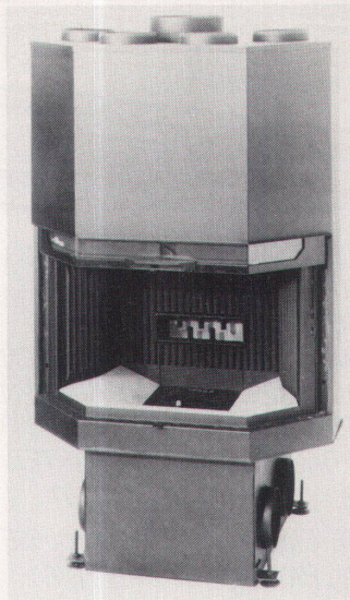
Kleiner Holzverbrauch und Warmluft für vier Räume beim Sparflam Gamma von Rüegg, Zumikon