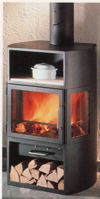
Einfaches Stahlmodell Opus von AC-Cheminéeöfen, Steinhausen