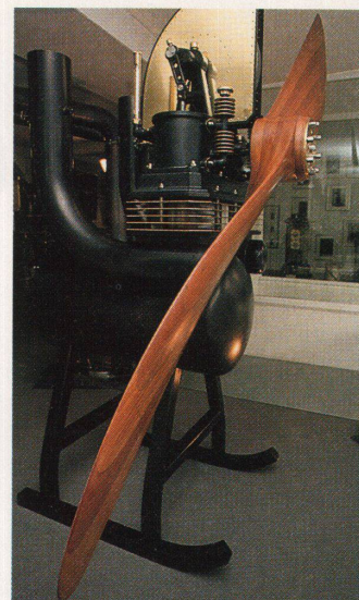
«Pegasus» von J.ch.B.: Inspirationen aus der Maschinenwelt