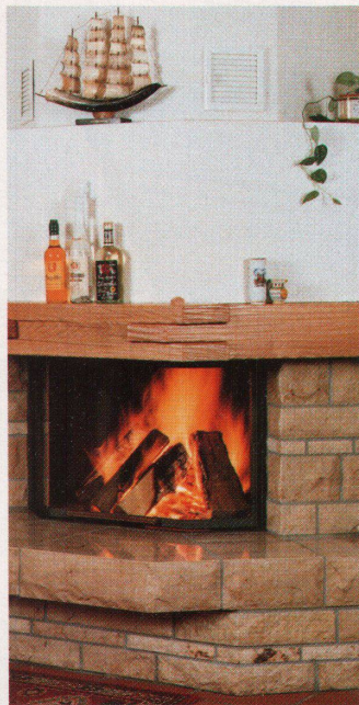
Die Schallgrenze der CO-Minimalwerte nach unten durchbrochen zu haben, rühmt sich der Öko 200 von Frei, Widnau