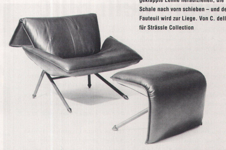
Ein Griff über den Kopf, die heruntergeklappte Lehne heraufziehen, die Schale nach vorn schieben – und der Fauteuil wird zur Liege. Von C. dell'Orso für Strässle Collection