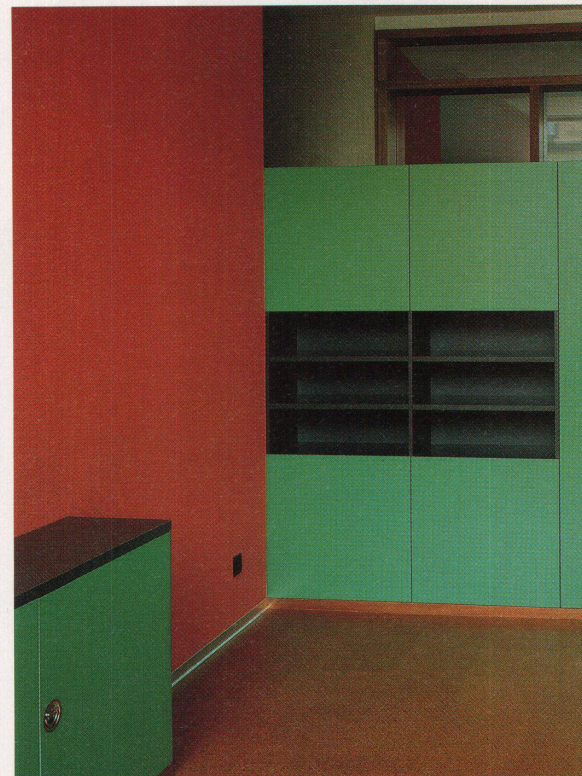
Die Farbgebung baut auf den Komplementärfarben Rot und Grün auf. Das Holz wird durch den Anstrich «denaturiert».

Die Halle mit Blick gegen die Glaswand zu den Lehrerarbeitsräumen (oben) und der Bibliothek (unten)