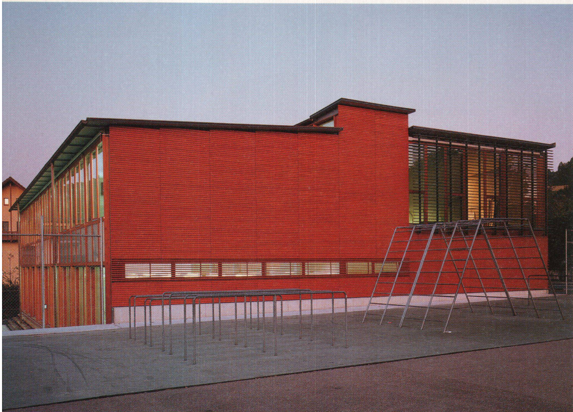
BILDER: HEINRICH HELFENSTEIN