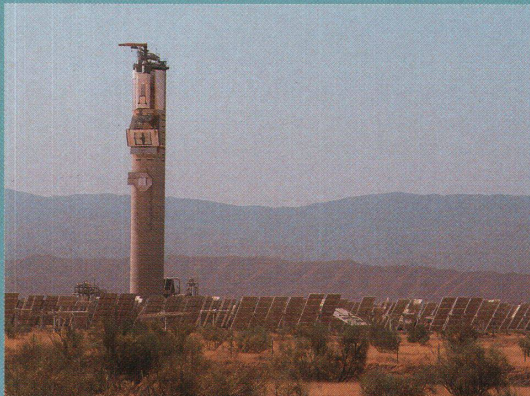
Die Turbine (links) einer der beiden Turmanlagen in Almería stammt (wie die übrigen) aus der Schweiz.

heimischen Solarofen werden Metalloxyde für die Brennstoffherzeugung untersucht. Und gegenwärtig tüfteln die Wissenschaftler auch an Verfahren für die solare Brennung von Kalk (ein Teilprozess bei der Zementherstellung). Sie brauchen dieses Verfahren zwar bloss als «Turngerät» für die Entwicklung von Solarreaktoren. «Aber wenn es super läuft», so Paul Kesselring, «könnte ein Drittweltland, dem es am Zugriff auf billiges Öl mangelt, diese Technik womöglich kompetitiv anwenden. Doch im Moment ist das noch Zukunftsmusik.»