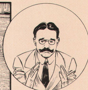
DER PRÄFECT RUDOLF WASMUTH: