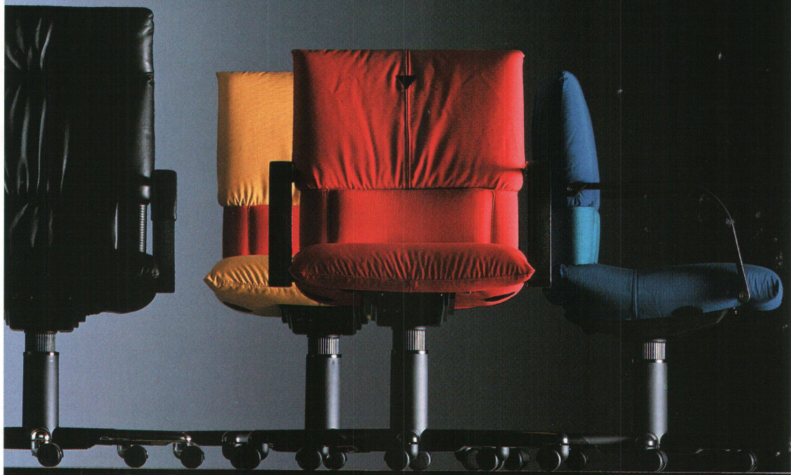
BELLINI COLLECTION. Figura (Büroarbeitsstuhl, Besuchersessel), Imago (Chefsessel und Besuchersessel). Weitere Informationen erhalten Sie von der Vitra AG, Schauraum Zürich, Würzgrabenstrasse 5, 8048 Zürich, Tel. 01/432 54 10.