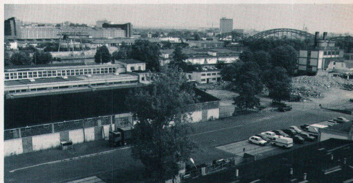
Zwar neu, aber schlecht genutzt: der «Alte Schlachthof» samt Neubau

Zwar ist beim «Osthafen» offiziell bisher nur die Rede von rund 2000 Wohnungen auf der Südmole. Inoffiziell, so schrieb die «Frankfurter Allgemeine Zeitung» (FAZ) am 2. April, bestehe längst der Plan, im zweiten Schritt die mittlere Mole und schliesslich auch den Streifen südlich der Lindleystrasse zu bebauen. Wenn diese Überbau-