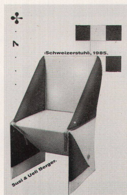
Schweizerstuhl, 1985. Suel & Ueli Berger.