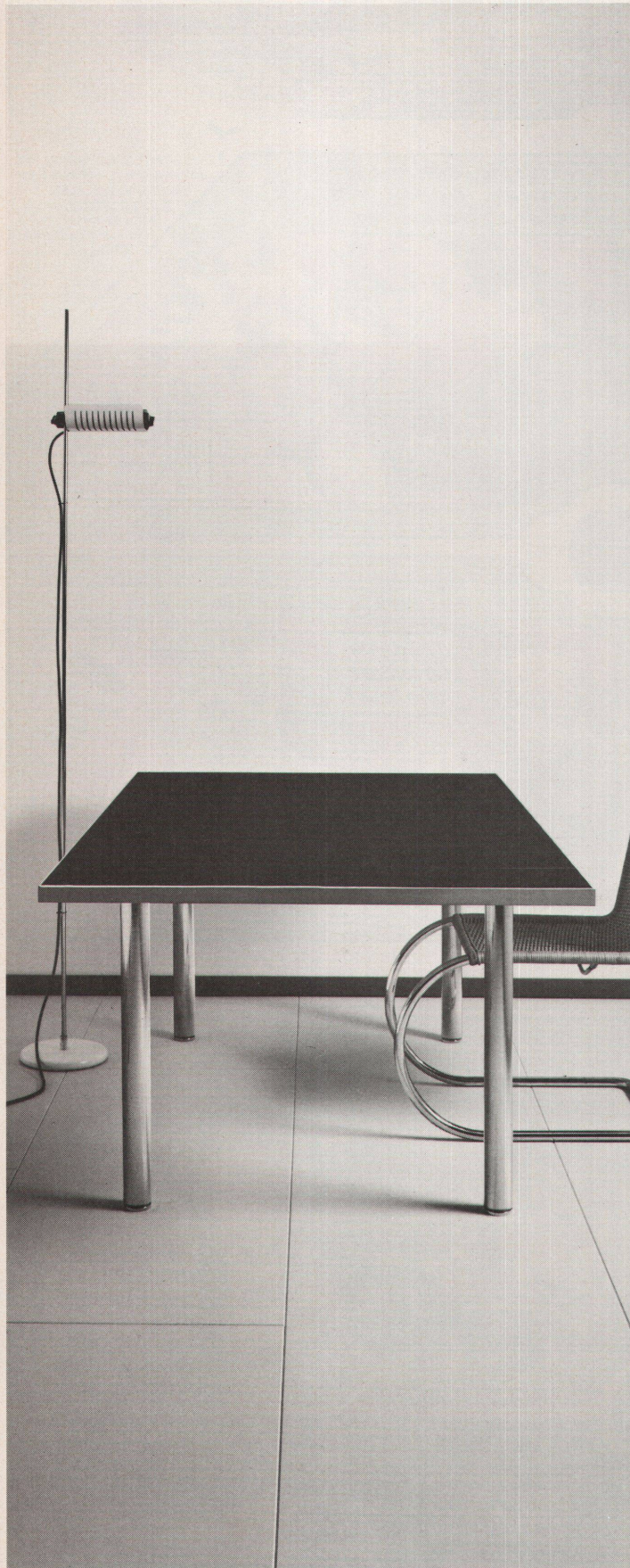
Der Linoleumtisch – Design: Silvio Schmed – ist typisch für das feine Handwerk aus der Möbel-Schreinerei Ph. Oswald. Sachlich, streng, perfekt in Form und Verarbeitung, ist er der Tischklassiker für mehr als einen Zweck. Jetzt zu sehen in der Ausstellung bei