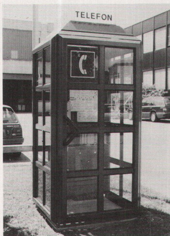
... oder mit Sprossen für Altstädte.