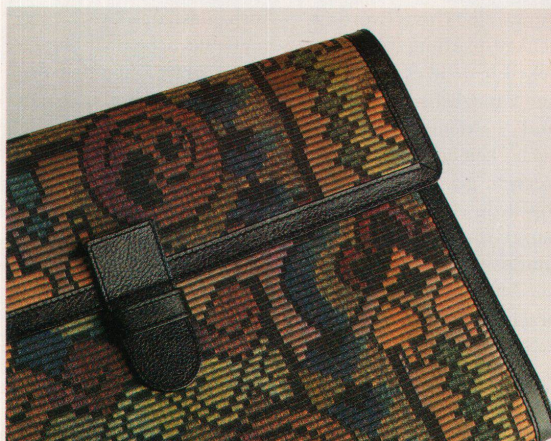
Dokumentenmappe aus der neuen Fischbacher-Kollektion

Frau von heute». Die Linie umfasst acht Gepäckstücke, vom Attaché-case zur Dokumentenmappe und vom Beauty-case zur Reisetasche. Die Artikel sind aus Stoff, haben eine Ledereinfassung und verfügen, je nach ihrer Bestimmung, über eine Anhängetikette.