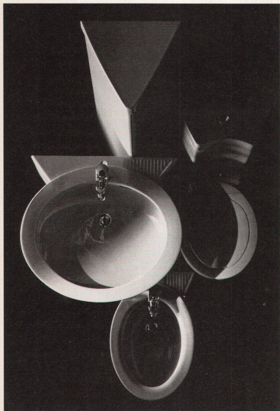
Der Hit bei Laufen: die Serie «Design by F.A. Porsche» – Spiel mit Dreieck und Oval

Miniaturen zur Veranschaulichung der Philosophie: Rollboy-Doppelsystem, Fritz Haller für USM 1964, im Massstab 1:10