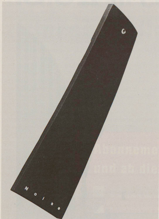
«The Noise» – das Telefon bleibt ein Telefon mit Muschel und Hörer.