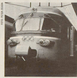
Exklusiv durch den Gottardo und zurück: Der frühere TEE-Zug «Gottardo», heute als EC im Gotthardverkehr und auf der Simplonlinie im Einsatz.

(Der vollständige Text ist erhältlich bei: ABS, Baslerstrasse 106, 8048 Zürich.)