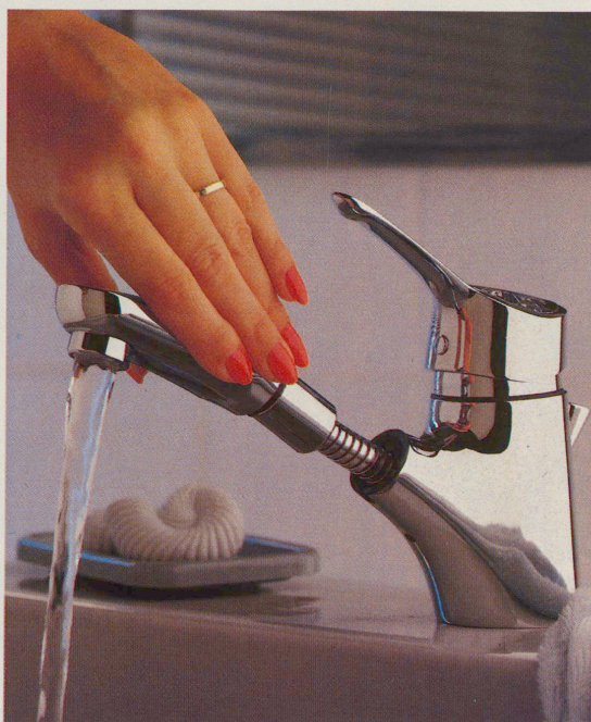
Mehr als nur ein Wasserhahn dank dem herausziehbaren Auslauf

Generalvertretung für die Schweiz: H. R. Fluri AG, 3073 Gümligen