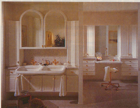
Ein Bad, das zum Verweilen einlädt. Ausführung Royal Weiss

sondern schafft auch mehr Bewegungsraum und Staufläche. Zusätzliche Bewegungsfreiheit wird auch durch die Redimensionierung der einzelnen Objekte gewonnen: Bidet und WC werden mit je 45 cm, Waschtische mit 60 und 120 cm ergonomisch (auch ein wichtiges Schlagwort in der Design-Umgebung!) und rationell eingeplant. So kann die Einrichtung variiert werden, z. B. durch eine zusätzliche Dusche, platzsparend übereck installiert.