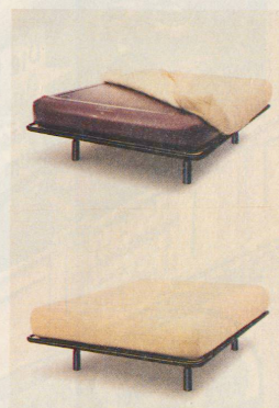
AirAqua – das Luft-Wasserbett für anatomisch richtiges Liegen und ruhigeres, entspanntes Schlafen

von gewöhnlichen Matratzen. Ein Überzug aus Baum- und Schurwolle, der Körpergerüche adsorbiert, schützt den mit Luft und Wasser gefüllten Matratzenkern aus Kunststoff. Faserservliesmatten in der Wasserkammer sorgen für ein ruhiges Liegen. Das Wasser wird mit einer Elektroheizung konstant auf gewählter Temperatur gehalten. Dies gestattet ein starkes Absenken der Zimmertemperatur: Die Energie wird also nur dort gebraucht, wo Wärme nötig ist.