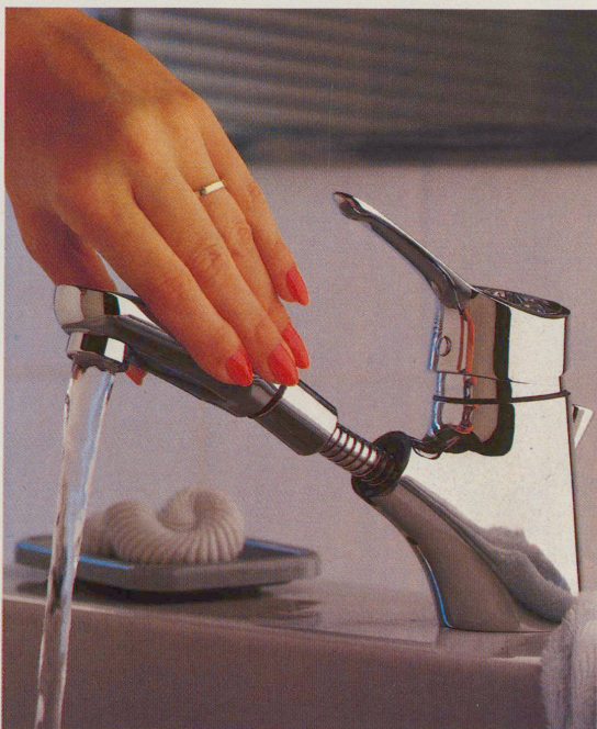
Mehr als nur ein Wasserhahn dank dem herausziehbaren Auslauf

Generalvertretung für die Schweiz: H. R. Fluri AG, 3073 Gümliwil