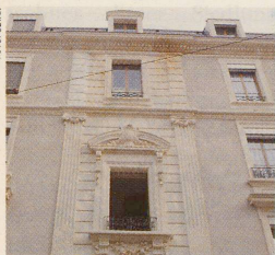
Das sanft renovierte Quartier des Grottes in Genf. Seite 78