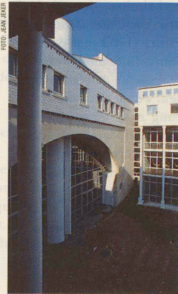
Das Gymnase de Nyon (Bild) und die Baufachschule in Tolochenaz, zwei neue Schulbauten im Welschland. Seite 62