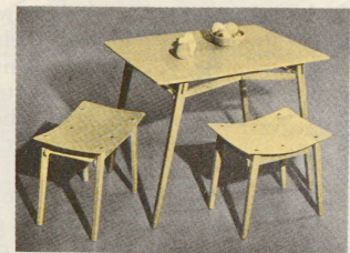
Jacob Müller: «Plio» Klappmöbel «für Freizeit und Garten», 1951.

9.11. Jacob Müller; Werkstoff Holz: Handwerk und Experiment. Aus der Reihe Schweizer Design-Pioniere 5. Bis zum 8. Januar 1989 im Museum für Gestaltung Zürich (Galerie).