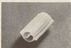
«Mandala» von Philippe Starck.