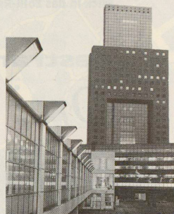
Das Torhaus in Frankfurt; links das Personalbeförderungssystem «Via Mobile».

25.10. Messehochhaus, Frankfurt am Main – Bau-Monographie von Oswald Mathias Ungers. Die Ausstellung ist bis zum 19. November im Architekturforum Zürich zu sehen.