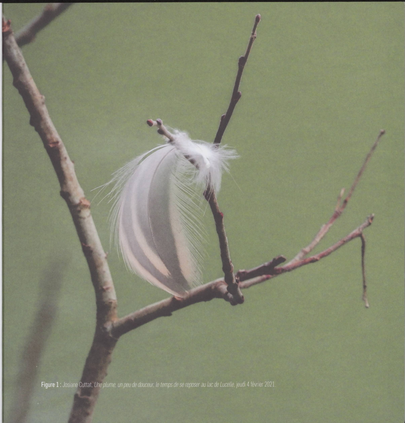
Figure 1 : Josiane Cuttat, Une plume, un peu de douceur, le temps de se reposer au lac de Lucelle , jeudi 4 février 2021.