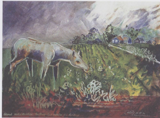
Figure 2 : Paul Boegli, dit Seeberg, Cheval individualiste bouffant des patates du kolkhose , acrylique sur papier, 39 x 42 cm.