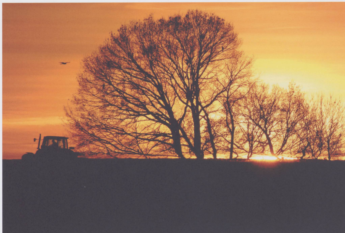
Figure 6 : Soleil couchant dans le finage entre Coeuve, Damphreux et Vendlincourt. L'agriculteur quitte son champ. L'heure de la traite l'appelle. 1 er décembre 2016.