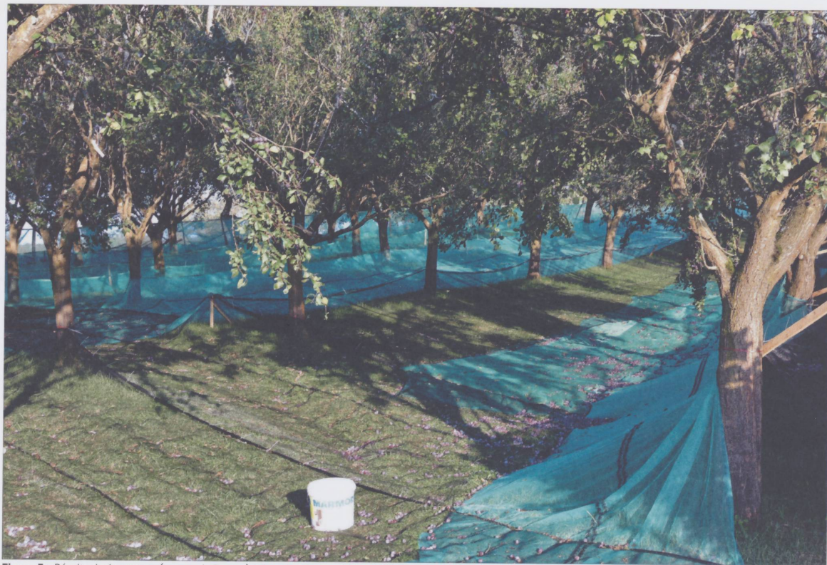
Figure 3 : Récolte de damassons (prunes de Damas) à Develier-Dessus, 20 août 2018.