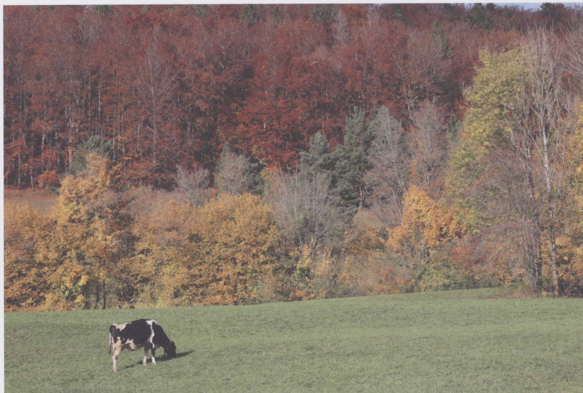
Figure 8 : Bel automne le long du Folpotat – dernières sorties dans les prés pour le bétail avant la neige. Soulce, 27 octobre 2020.