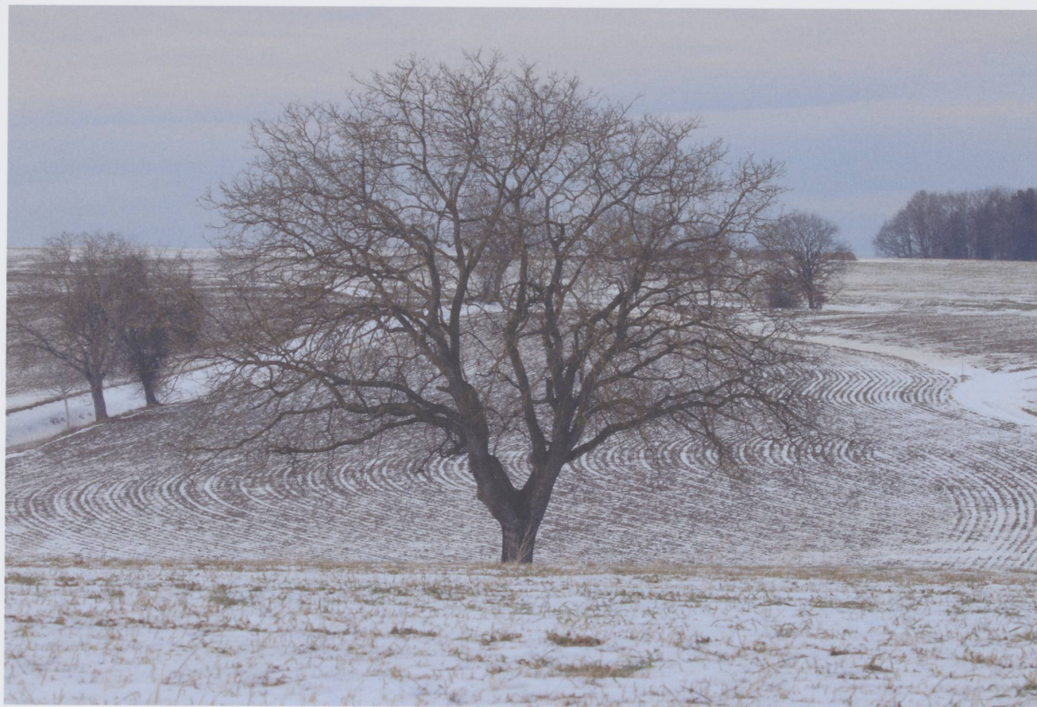
Figure 5 : Arbre nu entouré de vagues hivernales à Vendlincourt, 29 janvier 2017.