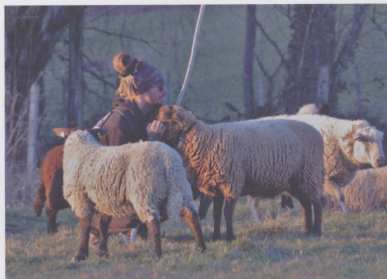
Figure 2 : Transhumance de passage au Mont-Choisi, hiver 2019.