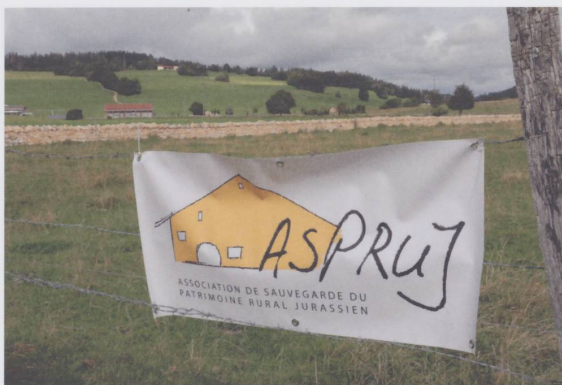
Figure 1 : Journées européennes du patrimoine Sous-le-Terreau au Noirmont, 2021.