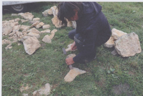
Figure 4 : Muretier en pleine démonstration de son savoir-faire lors des Journées européennes du patrimoine Sous-le-Terreau au Noirmont. (Photo Christine Choffat, 2021)