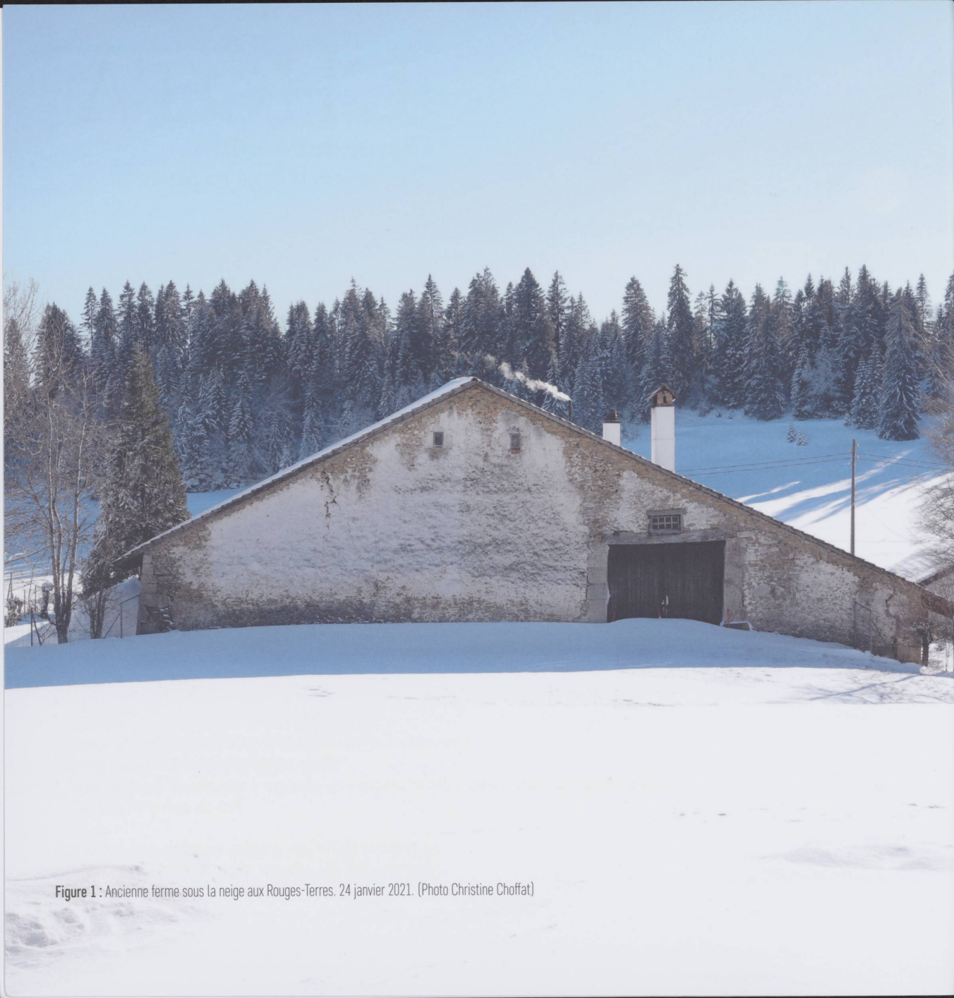
Figure 1 : Ancienne ferme sous la neige aux Rouges-Terres, 24 janvier 2021.