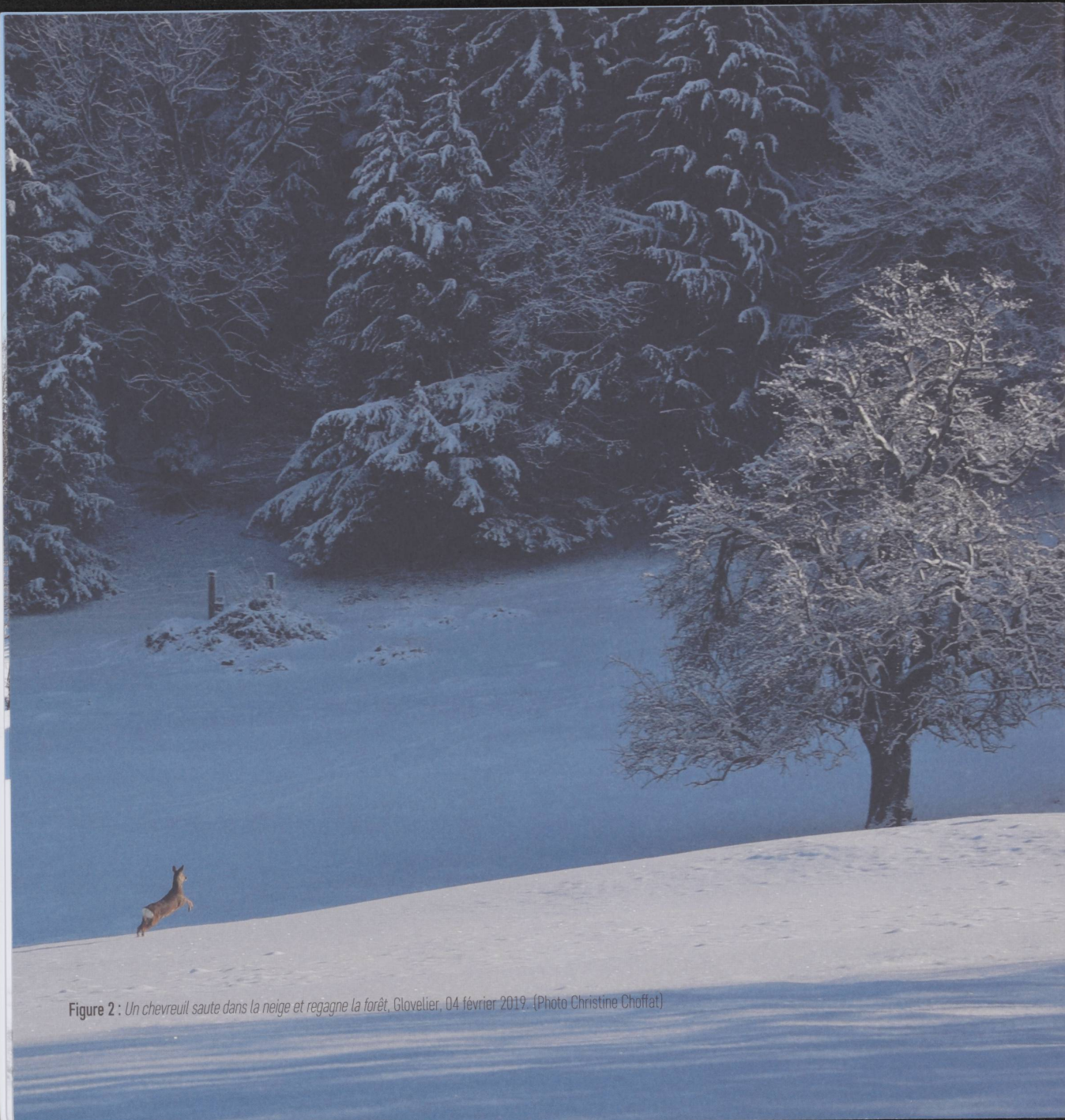
Figure 2 : Un chevreuil saute dans la neige et regagne la forêt, Glovelier, 04 février 2019.