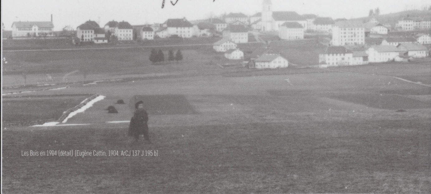
Les Bois en 1904 (détail) (Eugène Cattin, 1904, ArCJ 137 J 195 b).