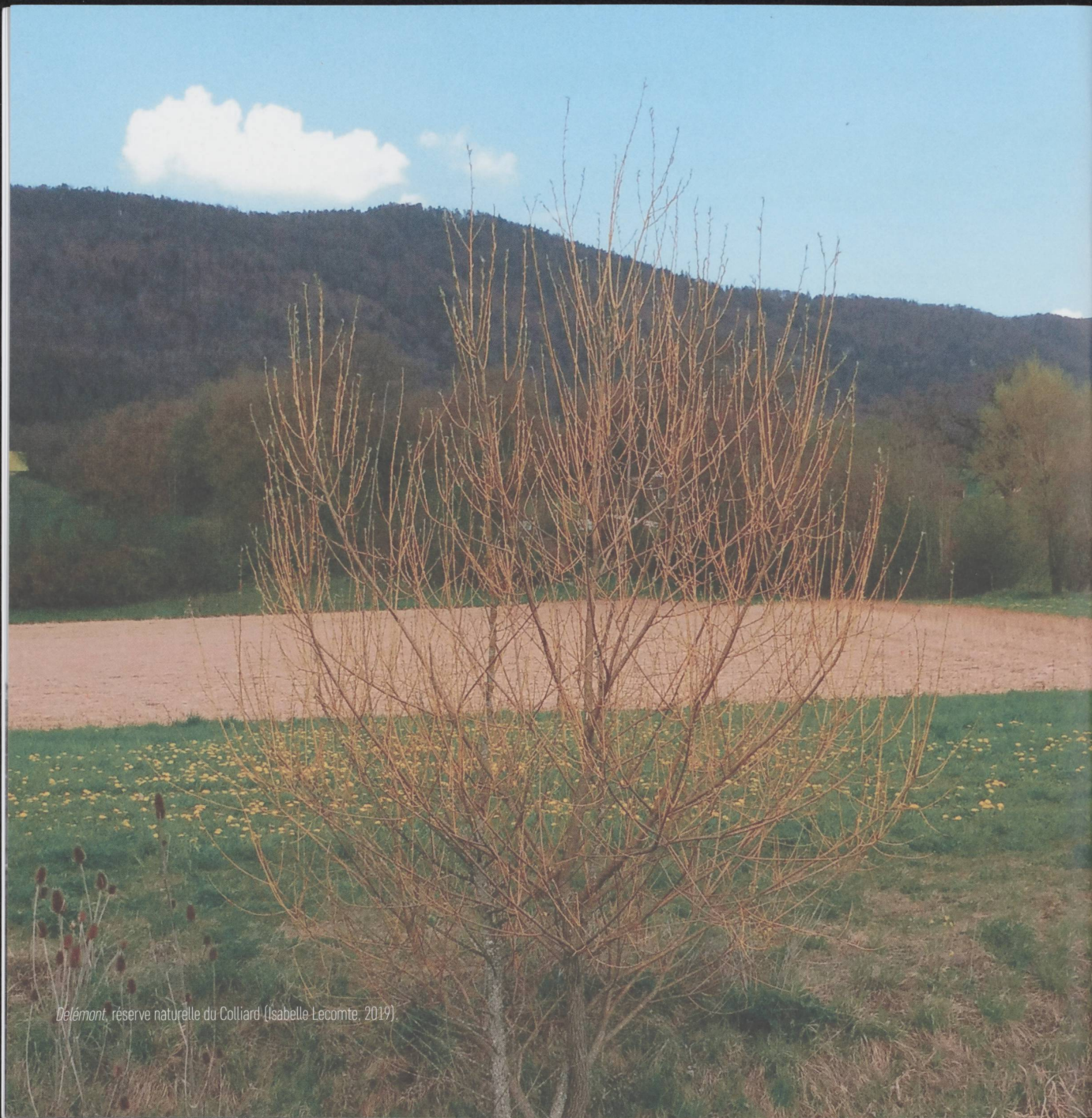
Delémont, réserve naturelle du Colliard (Isabelle Lecomte, 2019)