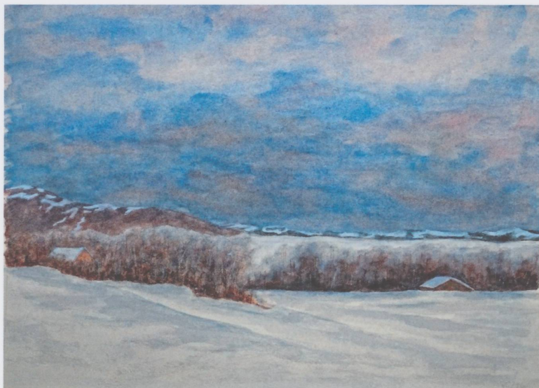
Sans titre, non daté, aquarelle sur papier, 19 x 27 cm.