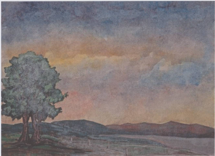
Sans titre, non daté, aquarelle sur papier, 19 x 27 cm.