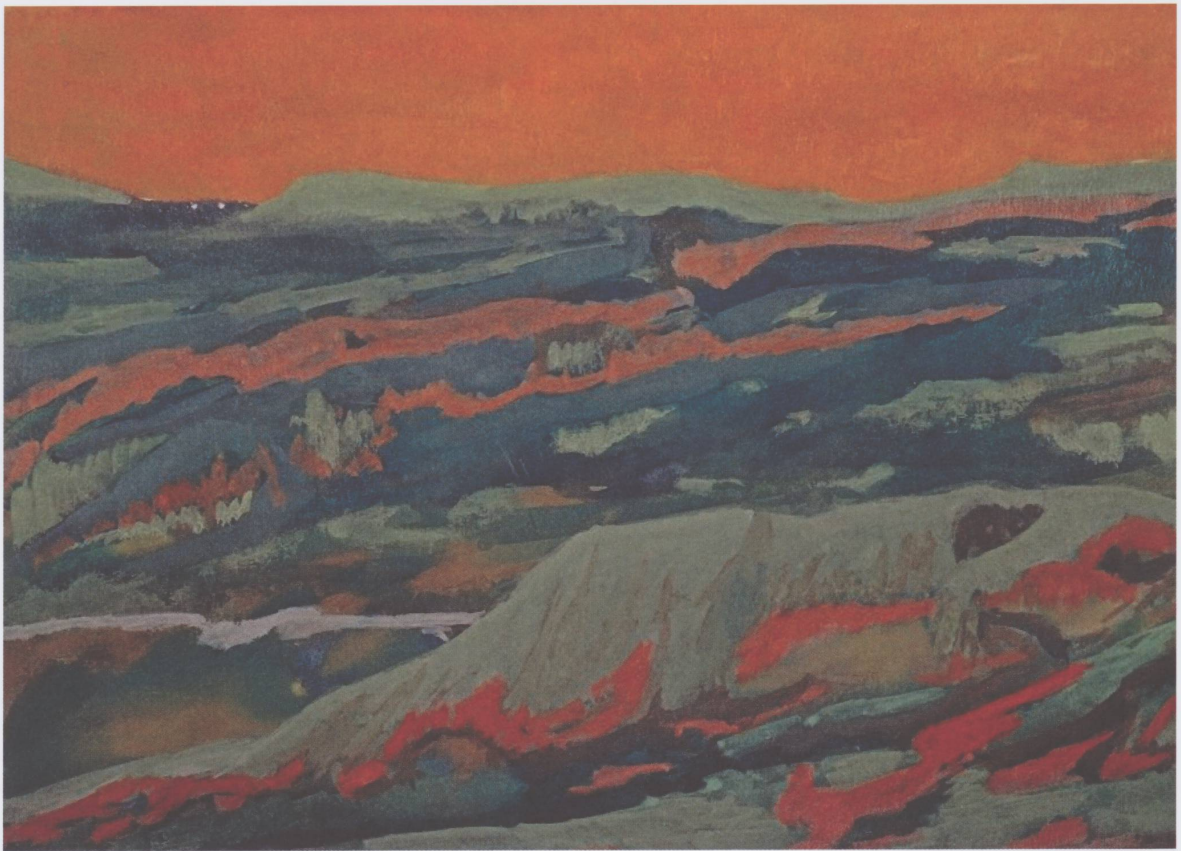
Sans titre, non daté, gouache sur papier, 19 x 27 cm.