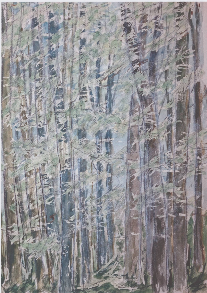
Sans titre, non daté, aquarelle sur papier, 29 x 22 cm.