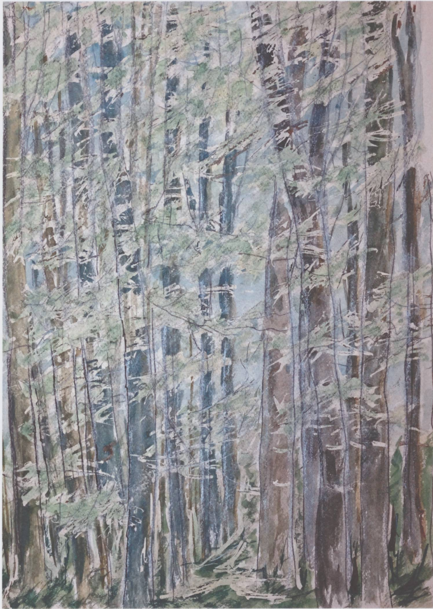
Sans titre, non daté, aquarelle sur papier, 29 x 22 cm.