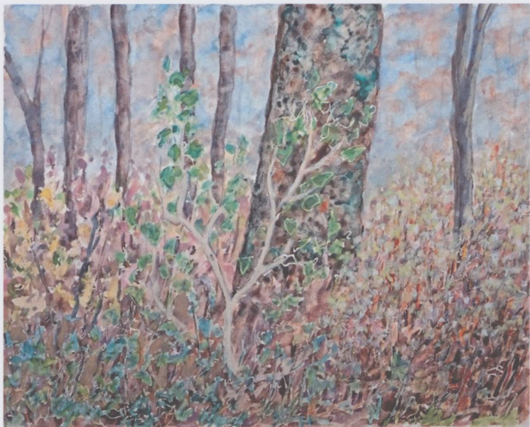
Sans titre, non daté, aquarelle sur papier, 18 x 23 cm (Photo Jean-Louis Merçay).