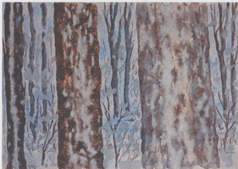
Sans titre, non daté, aquarelle sur papier, 22 x 30 cm. Collection Catherine Bonami-Theurillat.