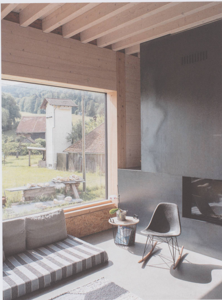
Figure 6 : Le salon avec vue sur le verger.