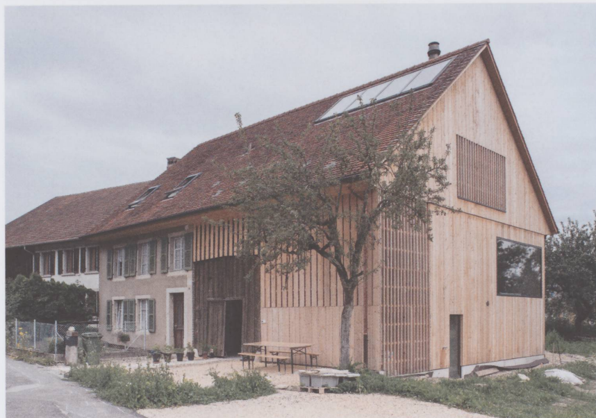
Figure 3 : Maison Vitalba rénovée, façade côté rue.