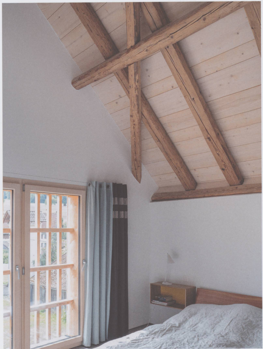
Figure 10 : La chambre et les poutres laissées apparentes.