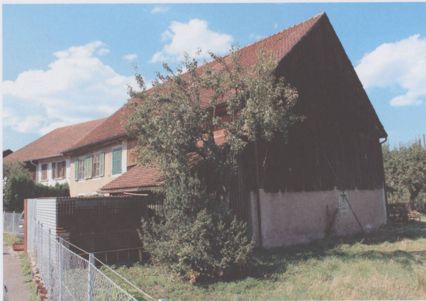
Figure 2 : Le rural avant la transformation.