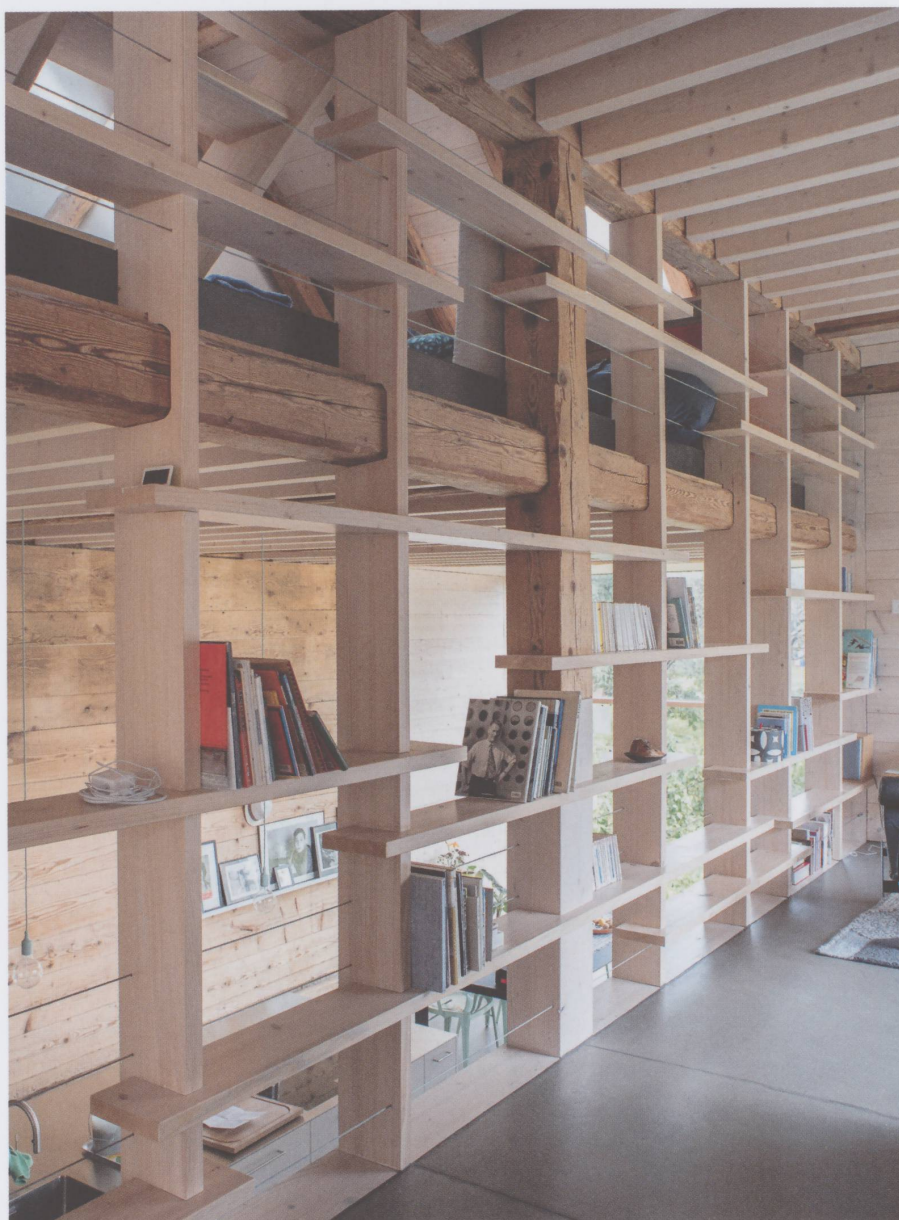
Figure 9 : La cloison-bibliothèque. (Photo Jonas Hänggi, 2017)