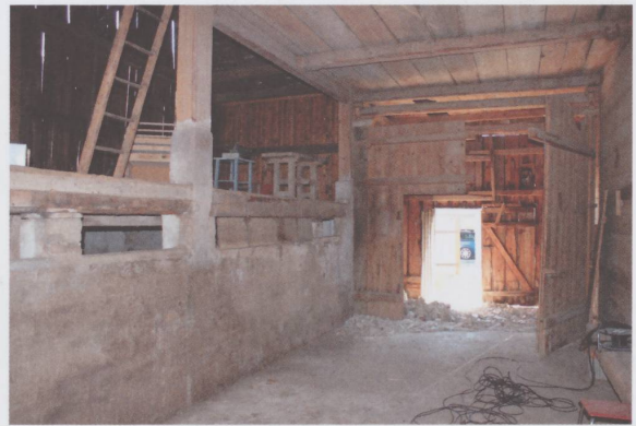
Figure 1 : Le rural avant les transformations.

Les grands volumes existants et le choix de matériaux bruts (chape, tôle noire, bois) permettent de garder l'ambiance « grange », tout en offrant un confort maximal aux occupants.