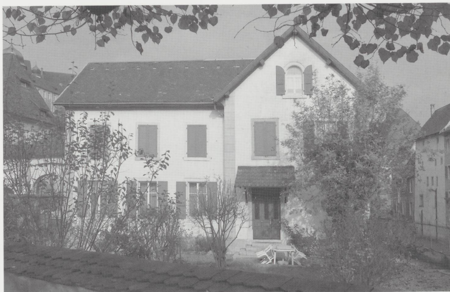
Le bâtiment de la loge La Tolérance, rue du Gravier 20 à Porrentruy, en 2004.

On doit à la loge La Tolérance la fondation de la crèche «La Charité» le 17 novembre 1901 et les soupes populaires qui étaient servies au Séminaire pour venir en aide aux démunis.