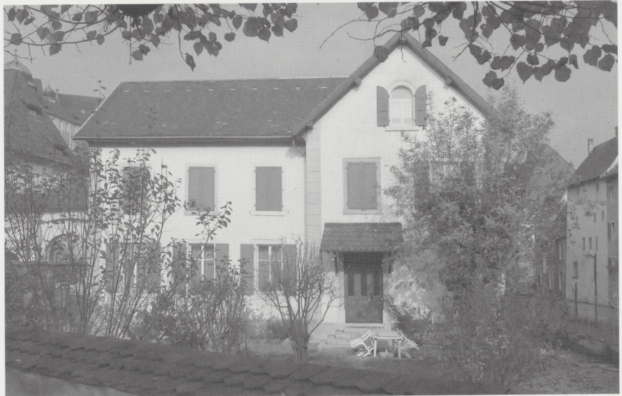
Le bâtiment de la loge La Tolérance, rue du Gravier 20 à Porrentruy, en 2004.

On doit à la loge La Tolérance la fondation de la crèche «La Charité» le 17 novembre 1901 et les soupes populaires qui étaient servies au Séminaire pour venir en aide aux démunis.