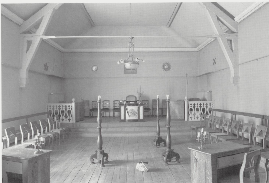
Le temple maçonnique de la loge La Tolérance en 2004.