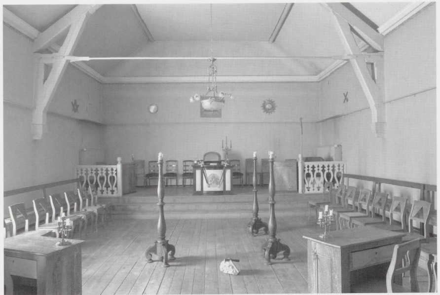
Le temple maçonnique de la loge La Tolérance en 2004.