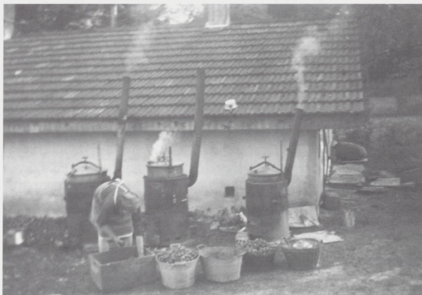
Cuisson des pommes de terre aux Prés Strayat en 1963.

La rubrique événements comporte une liste détaillée des événements et des années allant de 1815 à l'an 2000. On peut la consulter, soit en choisissant