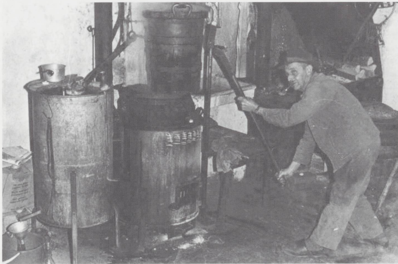
Distillation en 1970

Et c'est ainsi que je pris contact avec l'inventeur du logiciel afin de m'informer sur le coût des appareils ainsi que sur les modalités d'une formation pratique éventuelle. N'ayant pas de connaissances techniques en la matière, je n'avais d'autres ressources que de lui faire confiance ainsi qu'à son program-