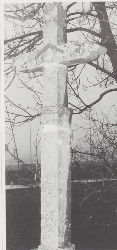
Croix de 1630.

œuvres remarquables, en bois de chêne, décorent une trentaine d'églises, dont celle du lieu.