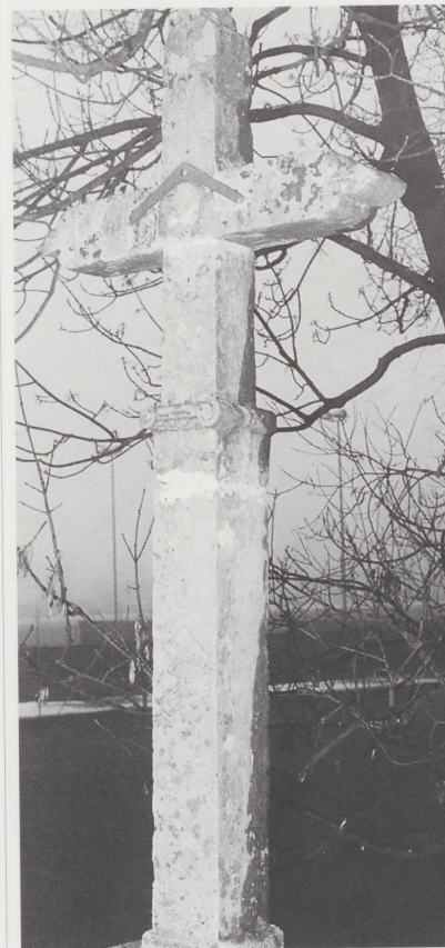
Croix de 1630.

œuvres remarquables, en bois de chêne, décorent une trentaine d'églises, dont celle du lieu.