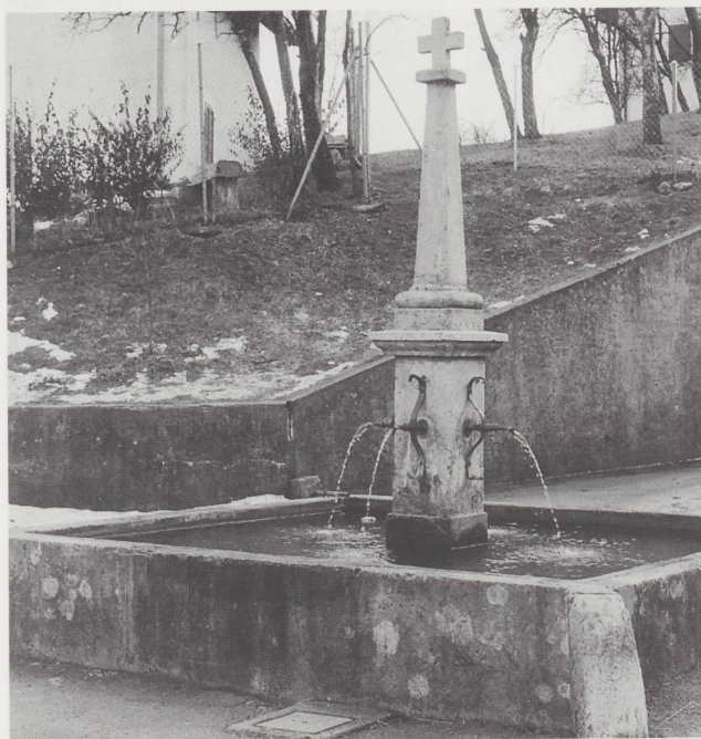
Croix de la fontaine à Mormont.

Il y a cinq croix à Courchavon et également cinq à Mormont. La croix de l'Eglise, marquant le Jubilé de 1851 porte l'inscription: «C'est ainsi que Dieu a aimé le monde.» En 1958 s'est déroulée une mission dans le village, qui se rappelle au souvenir par le crucifix de la «Croix-sée».