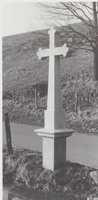
Croix sur la route de Grandfontaine à Rocourt.

On peut signaler que la croix de la route de Fahy est actuellement la seule en Ajoie qui figure sur une carte officielle (1:25 000).