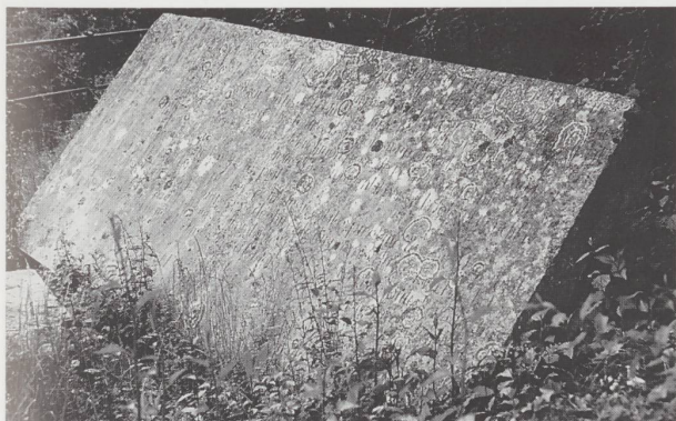
Grande dalle gravée près de la croix du Cras-d'Hermont.

à Porrentruy où une aquarelle, exécutée par le peintre Achille Schirmer (XIX e ), reproduit fidèlement le site, la dalle et l'inscription ! Lors d'une récente exposition, on a pu voir cette œuvre picturale accompagnée du texte explicatif suivant : «Sur la Croix du Voyebeux». Aquarelle, par Achille Schirmer, XIX e siècle. — «Pendant la terreur de la première Révolution française, un prêtre proscripé qui se sauvait par les bois, fut tué d'un coup de fusil à cette place même par un soldat républicain, qui l'avait aperçu. M. l'Abbé Daucourt le vieux a fait poser ce monument à ses frais en mémoire de ce triste événement.» Quant à l'inscription sur la dalle, elle décrit le passage évangélique dans lequel Pilate livre Jésus au peuple juif. Pour tenir compagnie à la croix d'Hermont, n'oublions pas de signaler que six autres croix sont érigées à Porrentruy. On en trouve les références à la fin de ce volume.