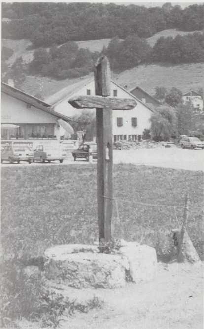
Croix avec niche pour une statuette à Ocourt.

Dans la localité d'Ocourt, on remarque une croix en fer datée de 1822 ainsi