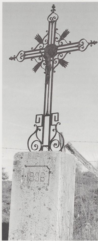
Croix des Petits Agats à Epauvillers.