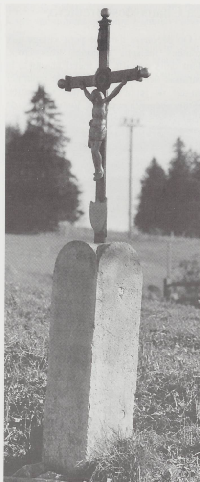
Croix au Cerneux-au-Maire.