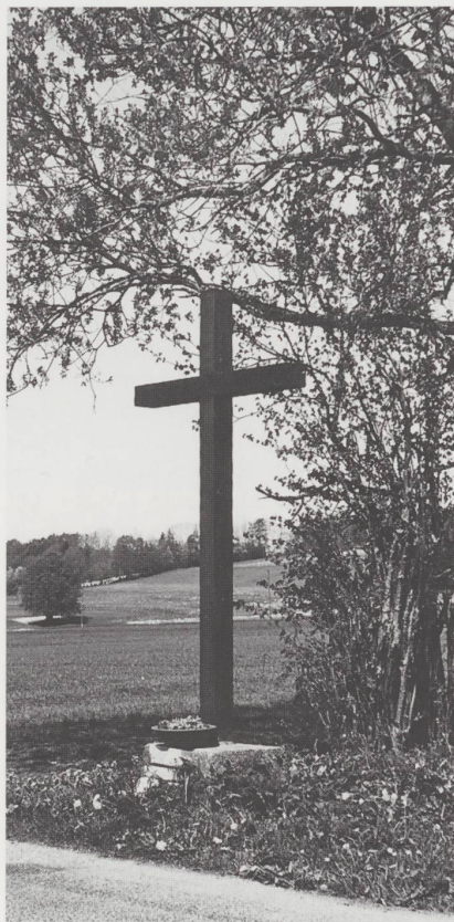
Croix entre Fornet-Dessus et Fornet-Dessous.

marque les frontières communale et cantonale, la limite du district, ainsi que la ligne de séparation des religions catholique et protestante, qui remonte au temps de la Réforme.