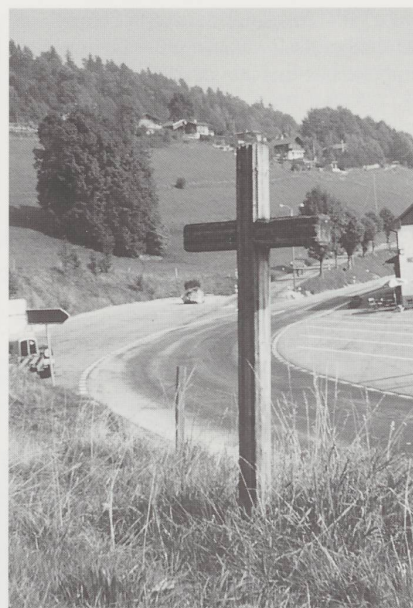
Croix de la Roche à Sceut.

Ce disant, il appuyait ses mains jointes sur son gros bâton qui s'enfonça dans le sol. Au moment où il le retira de terre,