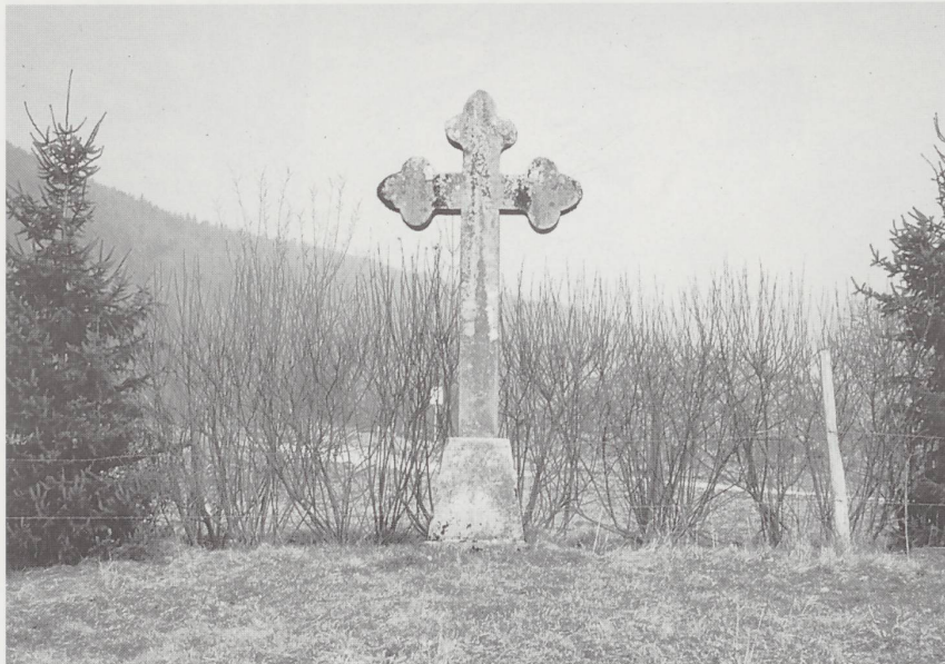
Croix du Colliard à Courroux.

Trois autres croix sont situées à Courcelon, village qui fait partie de la paroisse de Courroux. L'une se trouve au nord-est, la seconde au lieu-dit «Le Chêne» et la troisième au centre de la localité. Il faut aussi mentionner la présence à Courcelon d'une jolie chapelle, remarquable par la simplicité de ses lignes et la justesse de ses proportions. Elle fut construite en 1838 en vertu d'une donation des époux Joseph et Suzanne Cottenat.