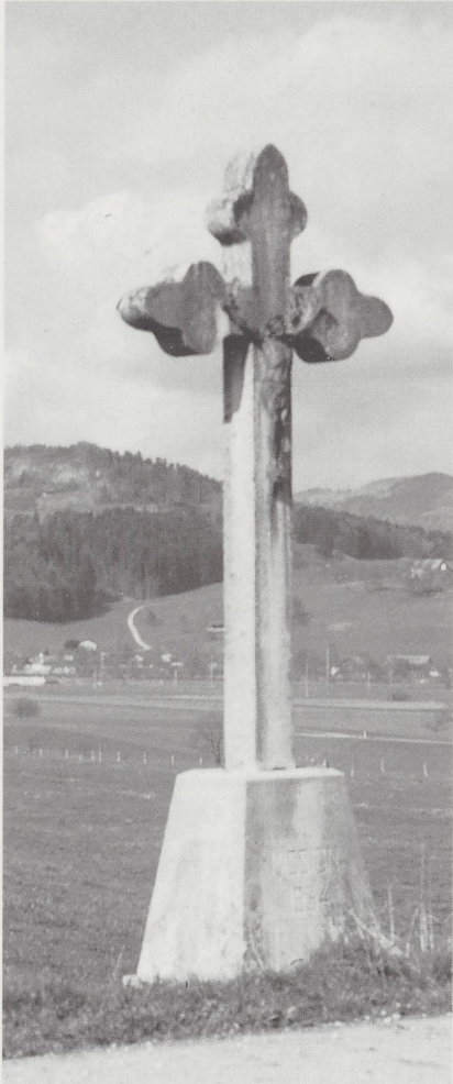
Croix du Nord à Rossemaison.