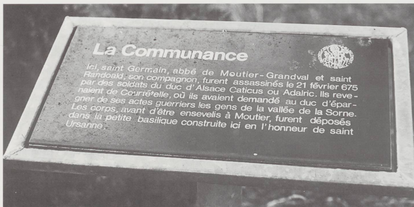
Plaque de la croix de Saint-Germain et Saint-Randoald à la Communance.

A la suite d'un nouveau déplacement, on peut l'admirer actuellement devant l'usine LEMO S.A., au bord de la route de la Communance. On veut espérer cet emplacement définitif: en effet, une convention datée du 17 mai 1990, met cette croix mémorable sous la protection de la municipalité de Delémont, de la bourgeoisie, de la commune ecclésiastique catholique et de l'entreprise précitée dont l'aide «a permis de perpétuer, par un geste tangible, le souvenir d'un événement historique».