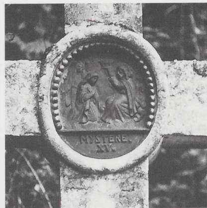
Détail d'une croix au chemin du Vorbourg.

croix, avec comme ornementation les quinze mystères du Rosaire étaient en place. Ce beau travail avait coûté 375 florins. Treize ans plus tard, en 1688, le Magistrat fit amener l'eau de la source des Boulaines au chemin des Adelles, ancien parcours des pèlerins, pour que les fidèles puissent étancher leur soif.