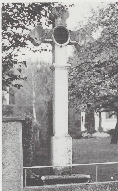
Croix au chemin du Vorbourg.