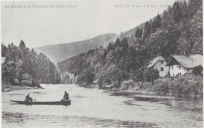
Une barque à fond plat au Bief-d'Etoz. (Ancienne carte postale)