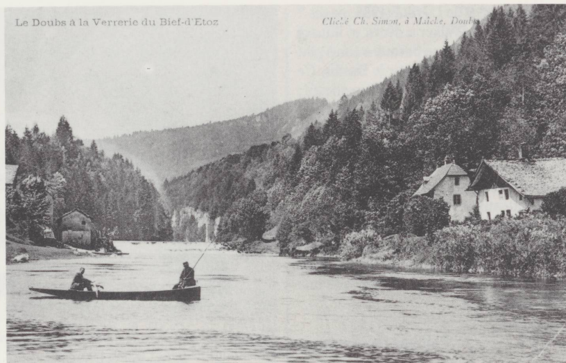
Une barque à fond plat au Bief-d'Etoz. (Ancienne carte postale)