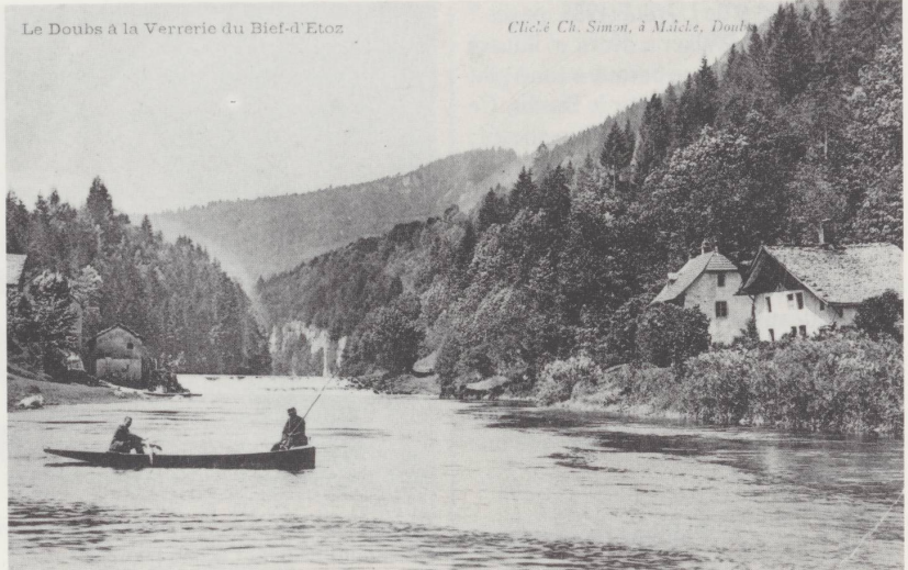
Le Doubs à la Verrerie du Bief-d'Etoz. (Ancienne carte postale)