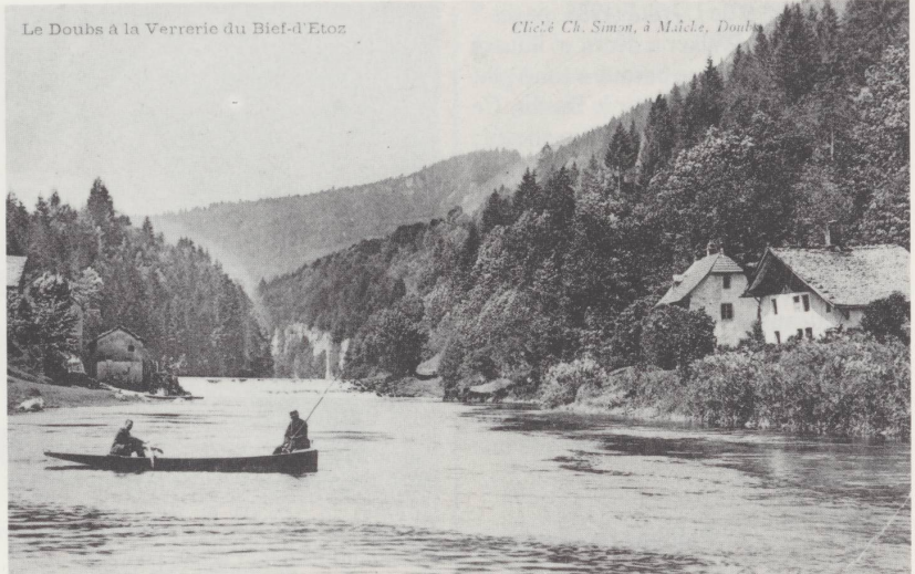
Une barque à fond plat au Bief-d'Etoz. (Ancienne carte postale)