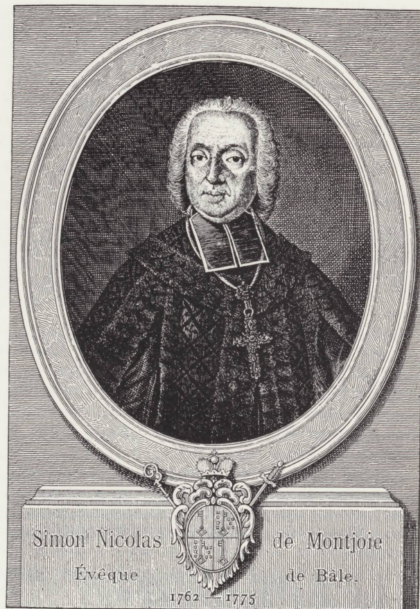
Gravure extraite de « Histoire des évêques de Bâle », par Mgr Vautrety.