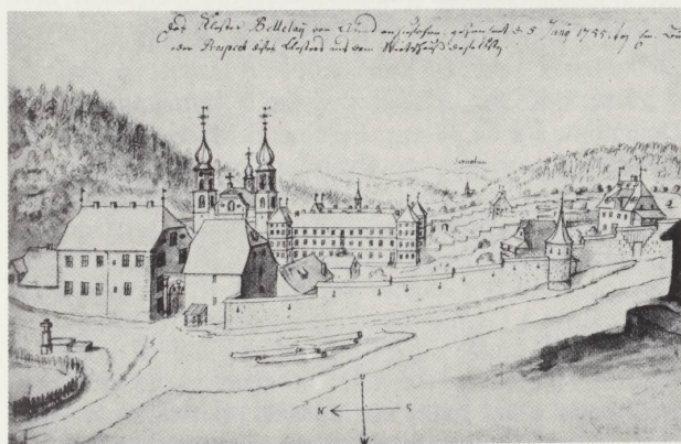
Collège et séminaire bâtis à Porrentruy par le prince-évêque Christophe Blarer de Wartensee. («Blarer de Wartensee» par André Chèvre, Bibliothèque jurassienne, Delémont, 1963)