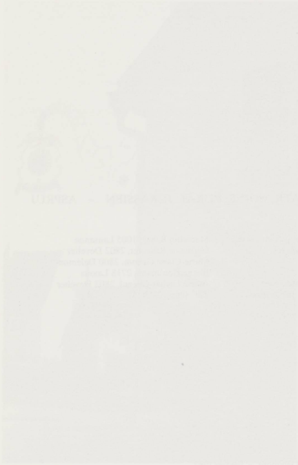
Le village de la Chapelle à Metz en 1915.