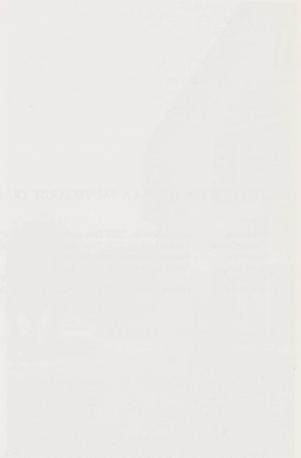
Le village de la Chapelle à Metz en 1915.