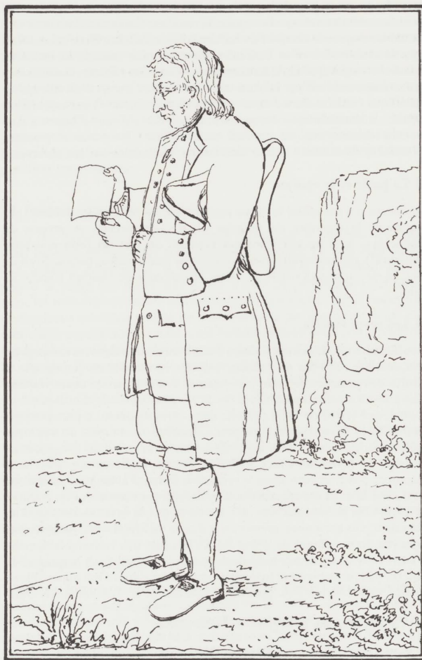
Dessin d'Auguste Quiquerez publié dans son ouvrage «Histoire des Troubles dans l'Evêché de Bâle en 1740».

Ces quelques remarques éclairent celles qu'on a lues par-ci, par-là, dans le texte d'Auguste Quiquerez, montrant que l'auteur de «Nos vieilles gens» partageait les idées de son temps, du moins celles des adultes et des intellectuels rassemblés dans les groupes d'étude de la Société jurassienne d'Emulation qui se penchèrent sur ce problème.