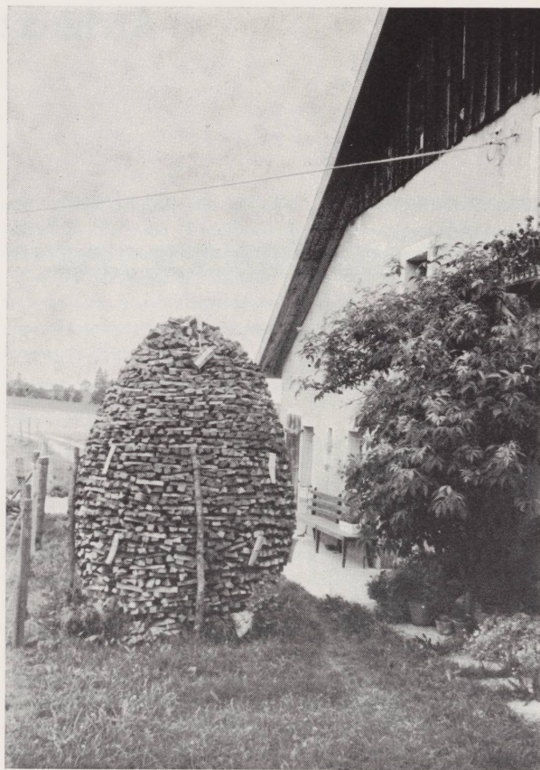
L'art d'entasser le bois à la Montagne de Sonvilier !

Le dessin de Michel Brouillot reproduit ici a orné les cartes que nous avons envoyées à tous nos lecteurs pour les inviter à venir visiter cette exposition. Si vous désiriez faire plus ample connaissance avec les maisons de cette