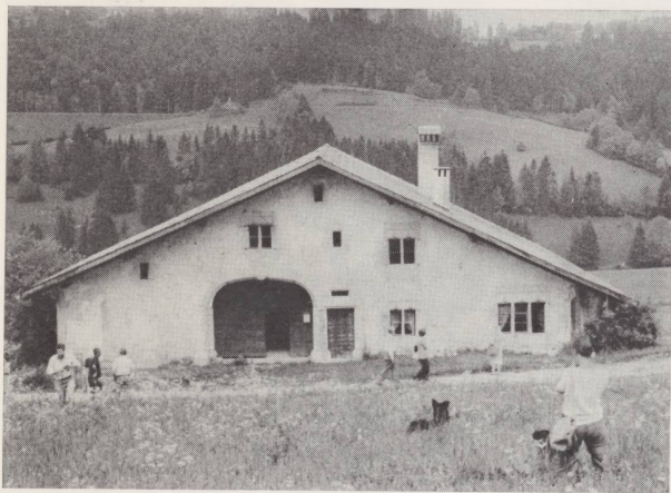
Les Convers : « La Brise ».

C'est donc samedi matin 10 juin, par un temps magnifique, qu'une septantaine de participants se sont retrouvés à Cormoret pour aller visiter une des plus anciennes fermes de l'Erguël, datant de la fin du XVIIe siècle, qu'un habitant du lieu vient d'acquérir et qu'il s'apprête à restaurer